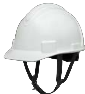
Cinghia sotto il mento NSB100CS