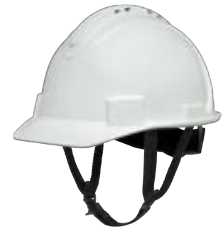
Cinghia sotto il mento NSB100CS