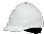
Elmetto areato a tesa corta Honeywell North Cod.: NSB11001E