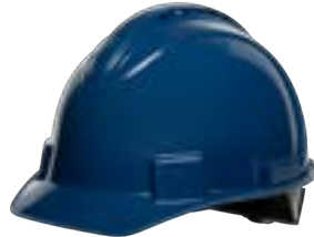
Azzurro scuro NSB11071E