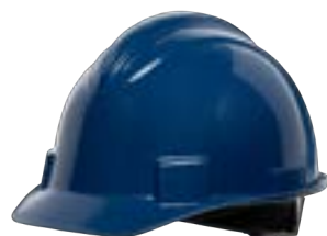
Azzurro scuro NSB10071E